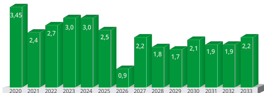
Quelle: Rentenversicherungsbericht 2019; Rentenanpassungen in den alten Bundesländern